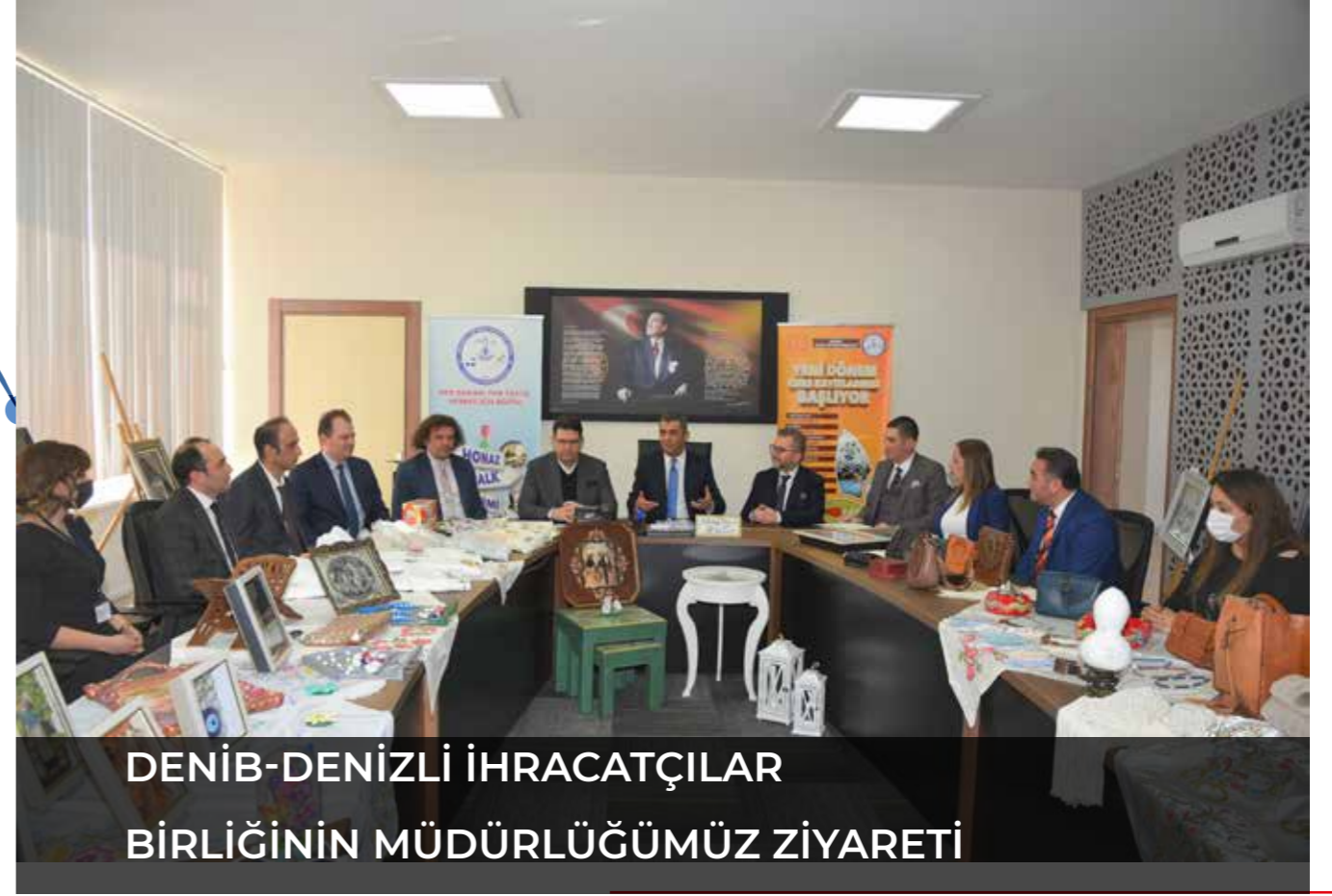
DENİZ-DENİZLİ İHRACATÇILAR BİRLİĞİNİN MÜDÜRLÜĞÜMÜZ ZİYARETİ