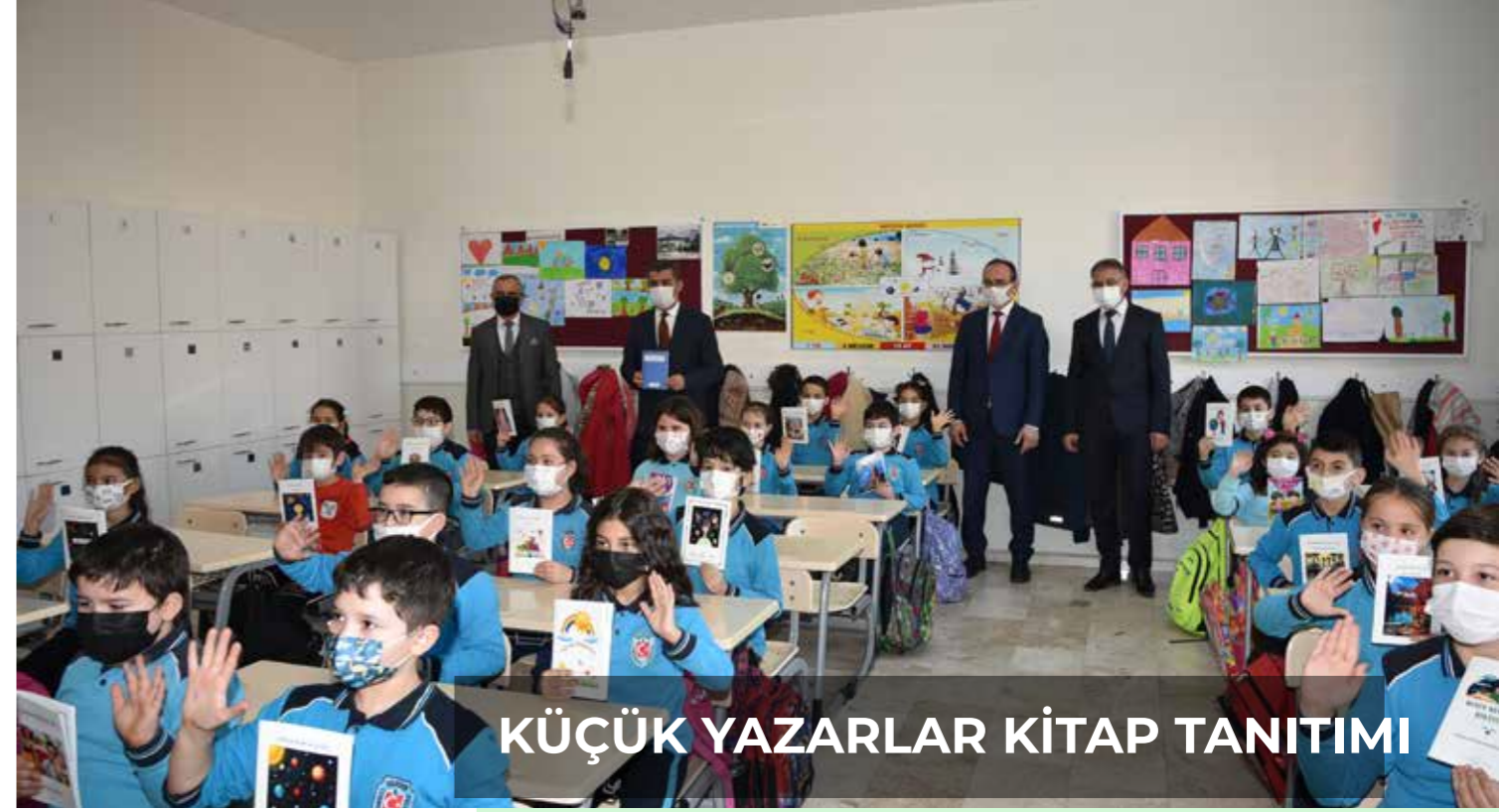
KÜÇÜK YAZARLAR KİTAP TANITIMI