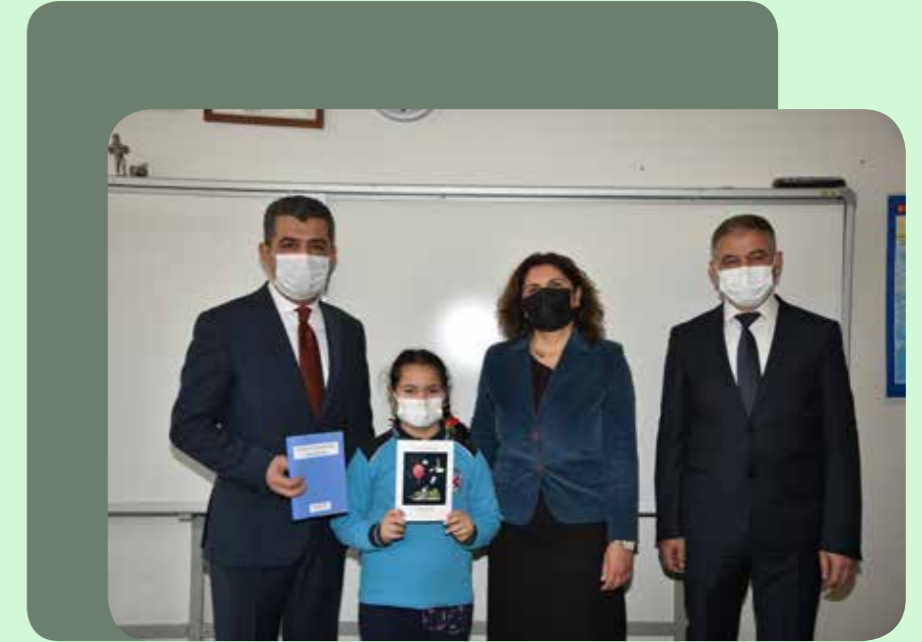
KÜÇÜK YAZARLAR KİTAP TANITIMI

Hacı İbrahim Demireren Cumhuriyet İlkokulu öğrencileri, salgın döneminde, kendilerinin yazdıkları hikâyelerden oluşan kitaplarını tanıttılar. Öğrenciler uzaktan eğitim sürecini, hikâye türünde yazdıkları metinleri kitaplaştırarak bir eser oluşturma deneyimi elde etmişlerdir. Kendi hayal dünyalarının yansıması ile oluşturdukları hikâyelerin kitaplaştırılması ile önemli bir deneyim elde eden öğrenciler kitabın yazarı olmaktan büyük mutluluk duyduklarını ifade ettiler.